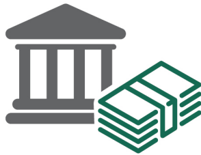
ДИНАМИКА АКТИВОВ MOLDOVA AGROINDBANK в 2014–2018 гг. (млрд леев)

На 49,2 млн леев или 12,5% увеличилась прибыль банка по сравнению с аналогичным периодом 2017 г., и составила 443,8 млн леев, что позволяет занимать Moldova Agroindbank первое место по этому показателю в банковском секторе страны.