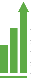
ДИНАМИКА ПРИБЫЛИ MOLDOVA AGROINDBANK в 2014–2018 гг. (млн леев)