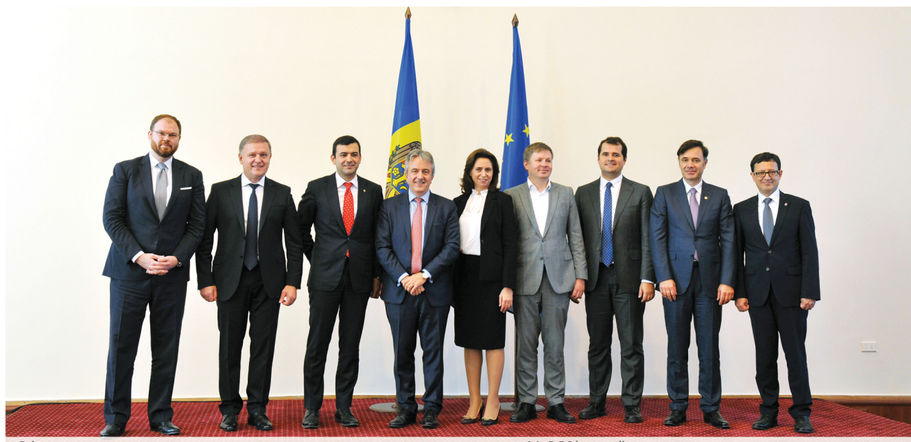
Официальная встреча по случаю подписания договора купли-продажи 41,09% акций

Выставленный на продажу пакет акций Moldova Agroindbank после двух лет ожидания наконец-то нашел новых хозяев. Важная роль в этом принадлежит государству в лице Правительства, которое приложило немало сил и времени на осуществление данной сделки. Теперь 41,09% акций самого крупного и важного коммерческого банка страны принадлежат международному консорциуму, состоящему из трех участников: ЕБРР, Horizon Capital и Invalda INVL. Таким образом, Moldova Agroindbank стал банком со 100% прозрачностью акционеров.