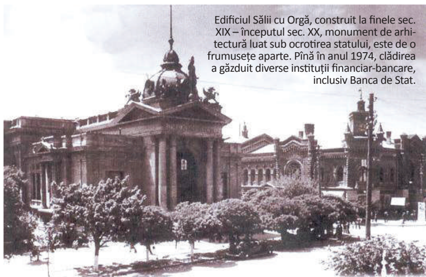
Edificiul Sălii cu Orgă, construit la finele sec. XIX – începutul sec. XX, monument de arhitectură luat sub ocrotirea statului, este de o frumusețe aparte. Pînă în anul 1974, clădirea a găzduit diverse instituții financiar-bancare, inclusiv Banca de Stat.

brie 1993 a monedei naționale – leul moldovenesc. Pe lângă bancnote, au apărut și monede – toate erau confecționate din aluminiu, chiar și cele de 50 de bani, care abia din 1997 sînt produse din alamă. Pentru emiterea monedelor din aluminiu au fost topite detalii din paturi pliante, linguri și furculițe. Prima monedă jubiliară, de argint, a apărut în 1996, fiind prilejuită de cea de-a cincea aniversare a independenței Republicii Moldova.